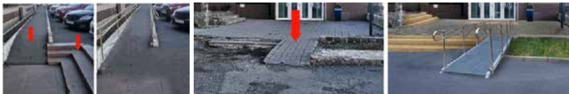
Рис. 5. Проектные предложения студентов по реконструкции мест, не обеспечивающих доступность среды, выполненные в компьютерной графике