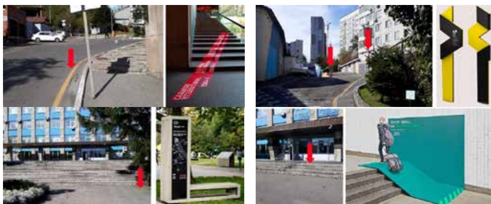
Рис. 4. Проектные предложения студентов по наполнению среды средствами информации и ориентации на основе аналогичных решений из отечественной и зарубежной практики

Для представления результатов и защиты проектной работы по адаптации существующей территории кампуса студенты оформили презентацию, в которую включили иллюстративный ряд, представляющий как предпроектный анализ исходной ситуации, так и собственные проектные предложения. Для наилучшей демонстрации результатов проектной работы на слайдах рядом были размещены фотографии существующих проблемных мест на территории кампуса и возможные варианты решения проблемы, представленные либо аналогами из проектной практики, либо графическими авторскими изображениями: чертежами и рисунками, выполненными в ручной или компьютерной графике. Примеры выполненных студентами проектных решений представлены на рисунках 4 и 5.