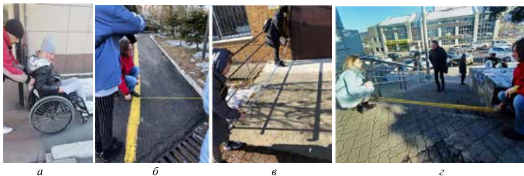
Рис.3. Этапы выполнения дизайн-программы: а) «прогулка с экспертом» по территории кампуса ВГУЭС; б) обследование территории; в) выполнение замеров; г) фотофиксация «проблемных мест» на основных транзитных путях

После сбора данных группа студентов проанализировала существующую ситуацию, сформулировала проблему и составила задание на проектирование, состоящее из списка задач, решение которых требовалось в процессе реконструкции и адаптации проблемных мест на территории кампуса. Перечень задач в списке представлен следующими пунктами: