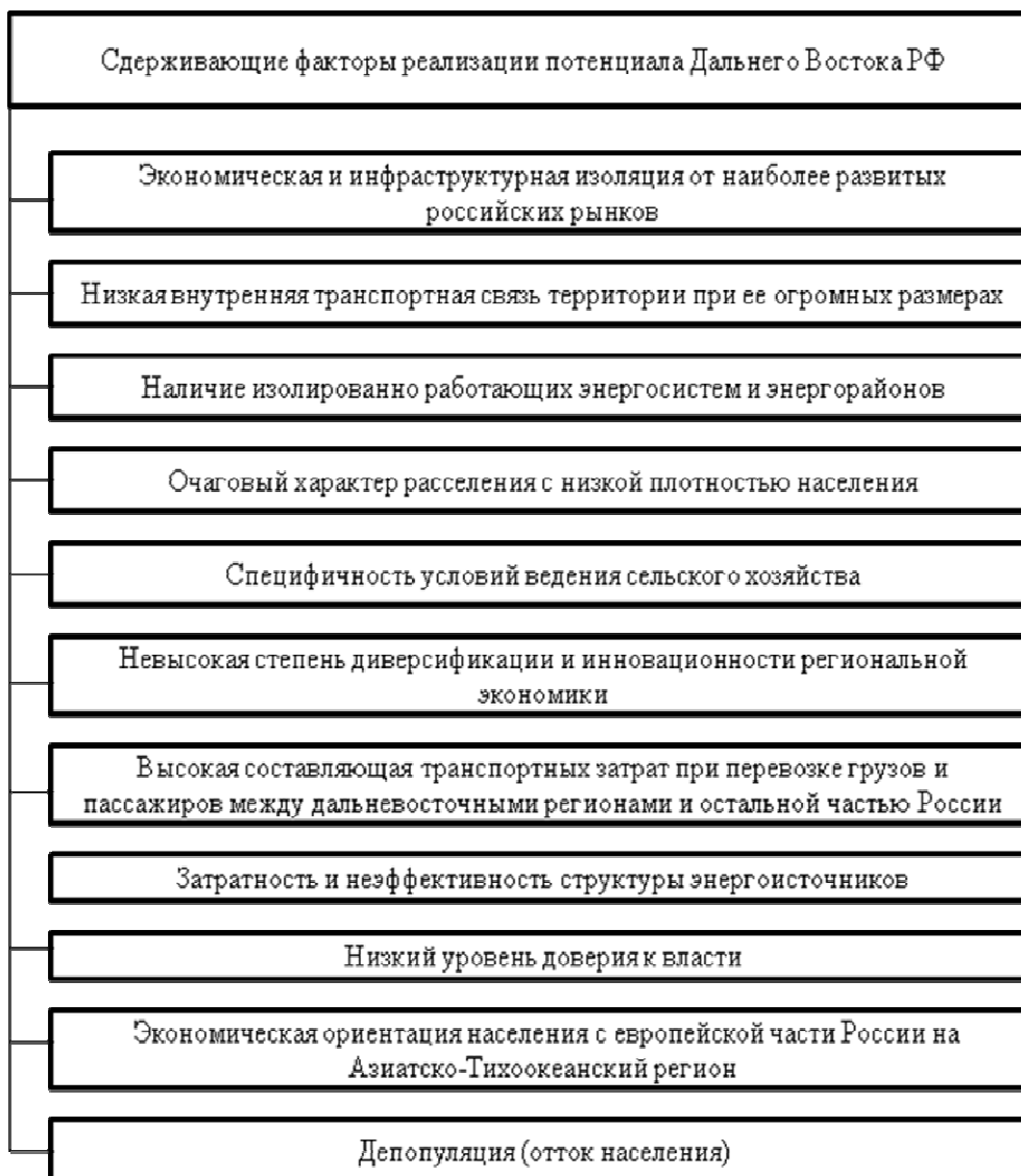
Рис. 3. Сдерживающие факторы реализации потенциала Дальнего Востока РФ

Для экономического развития Дальневосточного региона необходимо также привлечь возможности стран АТР при неоспоримой руководящей роли России. Развитие региона может быть эффективным только при двух условиях: широкое международное участие и акцент на человеческий, интеллектуальный капитал.