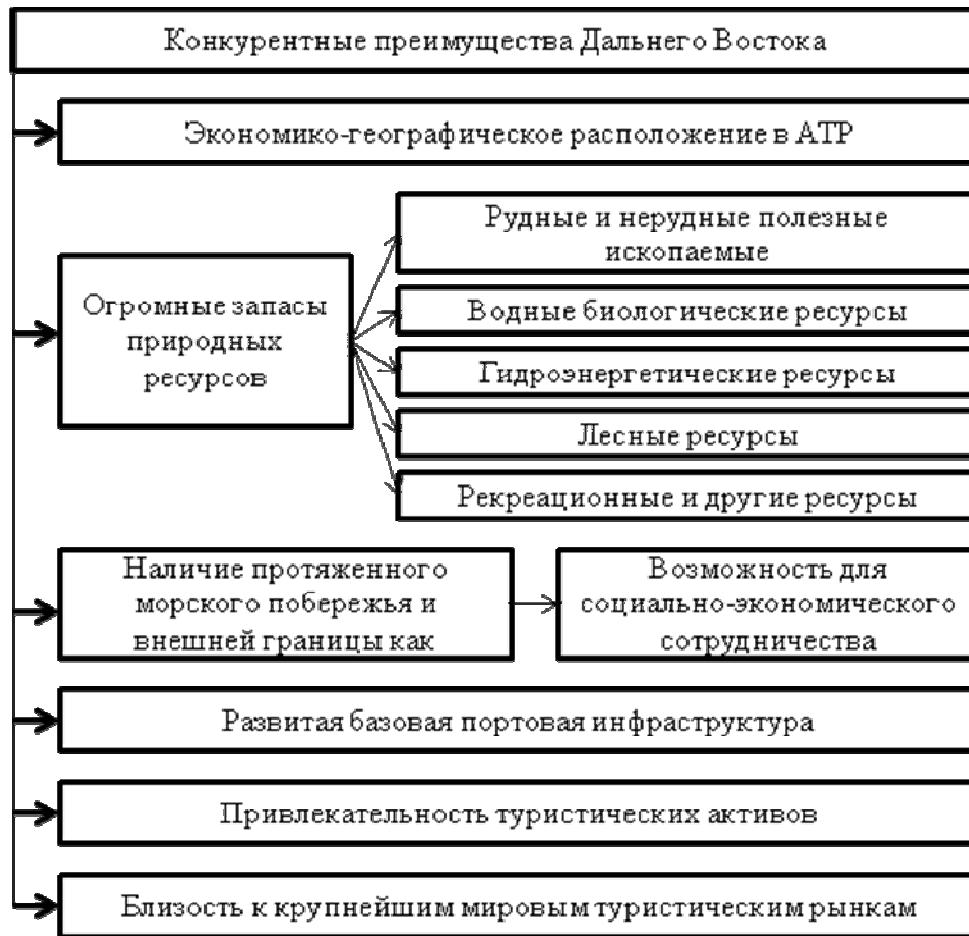
Рис. 2. Конкурентные преимущества Дальнего Востока

Реализация экономического потенциала зон опережающего роста и формирование комфортных условий жизни населения в значительной степени будут способствовать развитию Дальнего Востока и Байкальского региона.