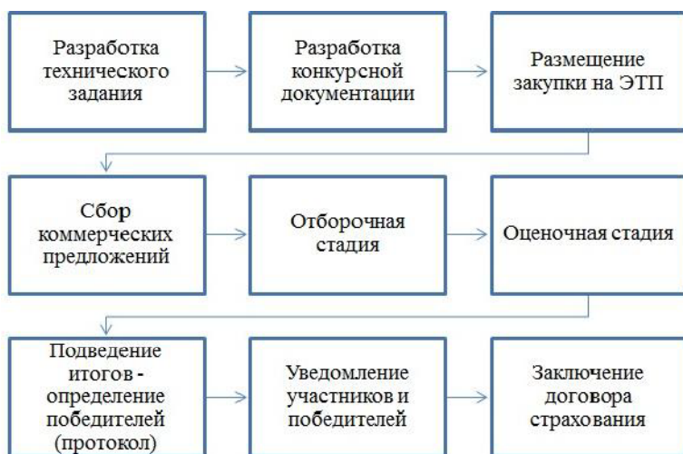
Рис. 6.2. Организация закупки услуги страхования

Проведенное исследование показало, что государственная поддержка агрострахования стимулирует сельскохозяйственных производителей на применение этого метода управления рисками, присущими сельскому хозяйству.