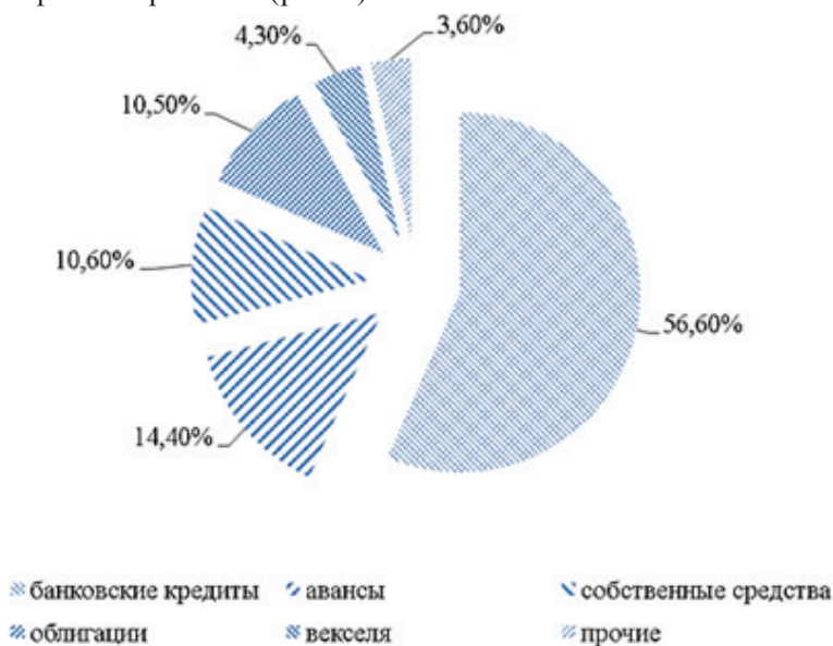
Рис. 3. Источники финансирования деятельности лизинговых компаний по итогам 9 месяцев 2017 года [9]

Это подтверждается данными рейтингового агентства «Эксперт РА», согласно которым на банковские кредиты в первые 9 месяцев 2017 года пришлось 56,6% всех источников финансирования (рис. 3).