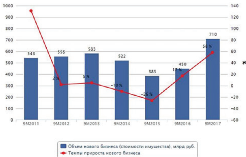
Рис. 1. Динамика объема нового бизнеса [9]

Лизинг является современной и прогрессивной формой финансирования бизнеса и потому активно развивается во всем мире. Российский рынок лизинговых услуг в последние несколько лет также имеет выраженную тенденцию к росту. По данным рейтингового агентства «Эксперт РА» прирост объема нового бизнеса за 9 месяцев 2016 года составил порядка 17%, в 2017 году положительная динамика данного показателя сохранилась (рис. 1).