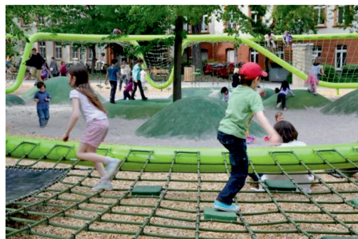
Рис. 4. Детская площадка в Висбадене (Германия)

Копенгаген, Дания, детская площадка (рис. 3). Паук размерами 4×7 м. Канаты паутины расположены на высоте от одного до двух метров. Нестандартные игровые комплексы развивают воображение, фантазию, исследовательскую и физическую активность детей.