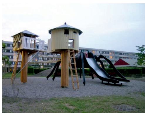
Рис. 3. Копенгаген, Дания. Детская площадка