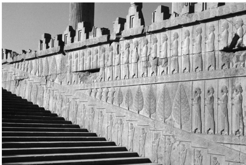
Рис. 5. Рельефы на лестнице во дворце Дария I

У персидского царя Дария I возникла проблема, схожая с проблемой Александра Македонского, но его метод продвижения своего образа среди завоеванных народов был другим. По всему периметру дворца правителя в Персеполе было приказано высечь рельефы с изображением идущих мерным шагом военных, слуг и представителей покорённых народов, со спокойными лицами несущих дары своему правителю [1]. Таким образом он позиционировал себя миролюбивым правителем. Единственное, что требовалось от народов для сохранения его расположения, это покорность и богатые подношения.