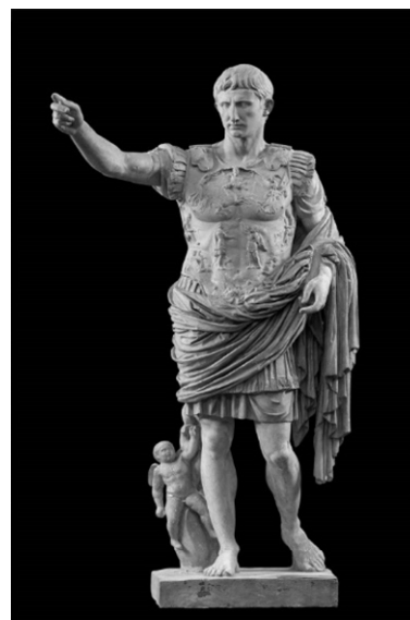
Рис. 5. Статуя Октавиана Августа из Прима-Порта

Таким образом, анализ действий политиков эпохи античности, проведённый с помощью модели коммуникации Г. Лассуэлла, позволяет сделать вывод, что данные исторические деятели смогли воспользоваться различными доступными каналами коммуникации и достигнуть нужного им результата. Эти приёмы продвижения образа до сих пор не потеряли своего значения. Итоги исследования по каждой из личностей представлены ниже в виде таблицы.