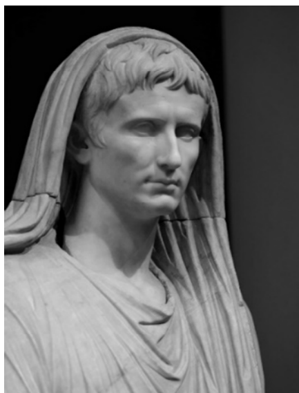
Рис. 4. Статуя императора Августа (деталь)

После удачной предвыборной кампании, ему удалось заручиться поддержкой электората обеих политических фракций и прийти к власти, при этом Октавиан Август не прекратил продвигать свой образ через искусство, хоть и со временем данный образ сменился с более “республиканского” к более “монархическому” облику сильного полководца. В глазах людей он также стал покровителем искусства, и даже поспособствовал зарождению и развитию нового жанра в искусстве – “августовскому классицизму”, характеризующемуся воспеванием образа императора (см. рисунок 5).