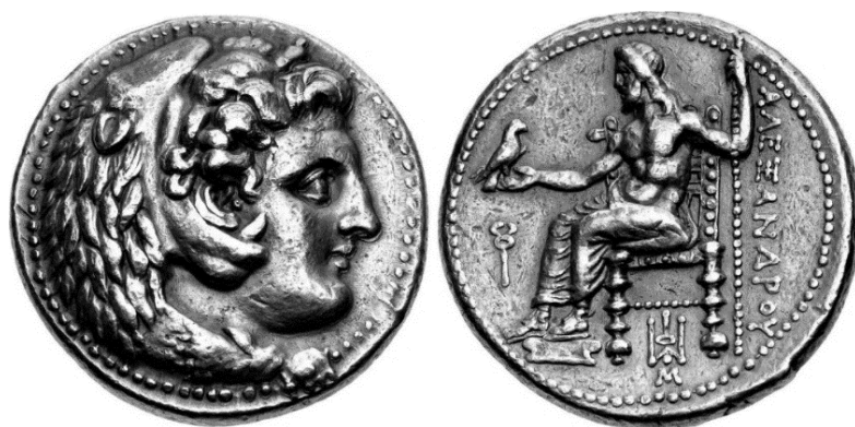
Рис. 4. Тетрадрахма Александра Македонского

Таким образом, печатая монеты со своим портретом, Александр Македонский не только породил целую традицию к печати портретов правителей на монетах, которая используется и по сей день, но также продвинул свой сильный образ с их помощью. Все жители державы Александра Македонского, пользовавшиеся этими монетами, знали и помнили облик своего царя и беспрекословно следовали за ним, обожествляя его фигуру.