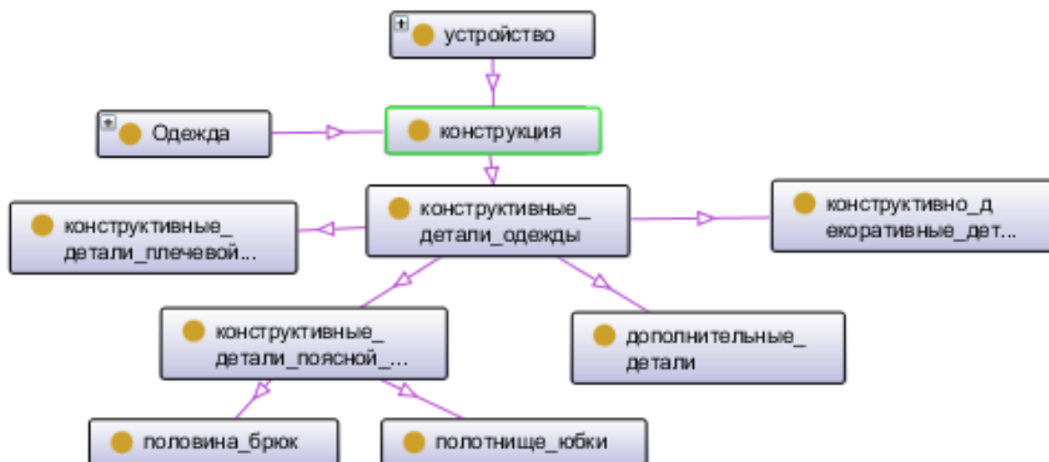
Рисунок 2 – Представление иерархической родо-видовой связи между терминами предметной области Технология швейных изделий

Родо-видовая связь устанавливается между двумя дескрипторами, если объём понятия нижестоящего дескриптора входит в объём понятия вышестоящего дескриптора (ГОСТ 7.25-2001). Например, «половина брюк» и «полотнище юбки» являются одним из видов «конструктивных деталей поясной одежды», в свою очередь, «конструктивные детали поясной одежды», являются одним из видов «конструктивных деталей одежды», а «конструктивные детали одежды» – одним из видов «конструкции» (рисунке 2).