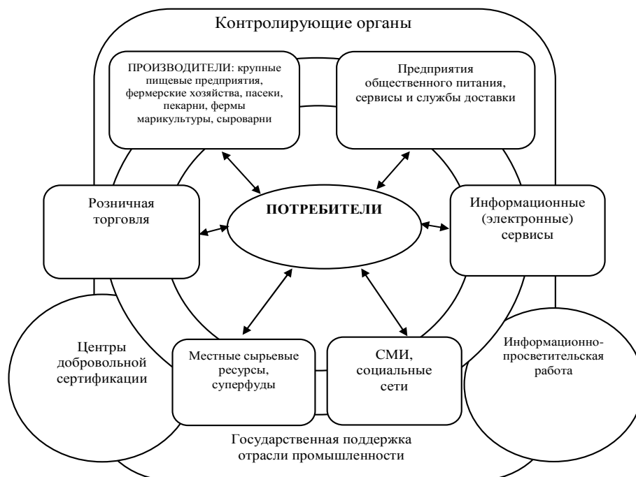
Рис. 3. Схема взаимодействия потребителей и поставщиков продуктов здорового питания

Для дальнейшего развития рынка здорового питания нами предложена схема взаимодействия потребителей и всех поставщиков ресурсов здорового питания на региональном рынке (рис. 3).