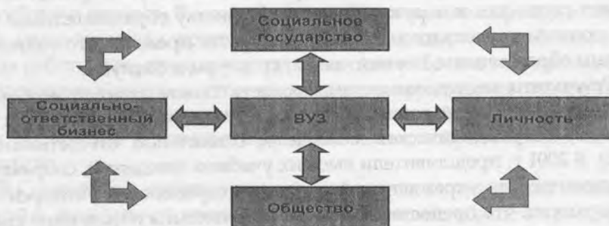
Рис. 1. Вуз в системе отношений социальной ответственности

и другими сторонами может быть представлена следующим образом (рис. 1).