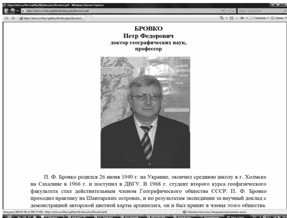
Рис. 2. Фрагмент первой страницы указателя