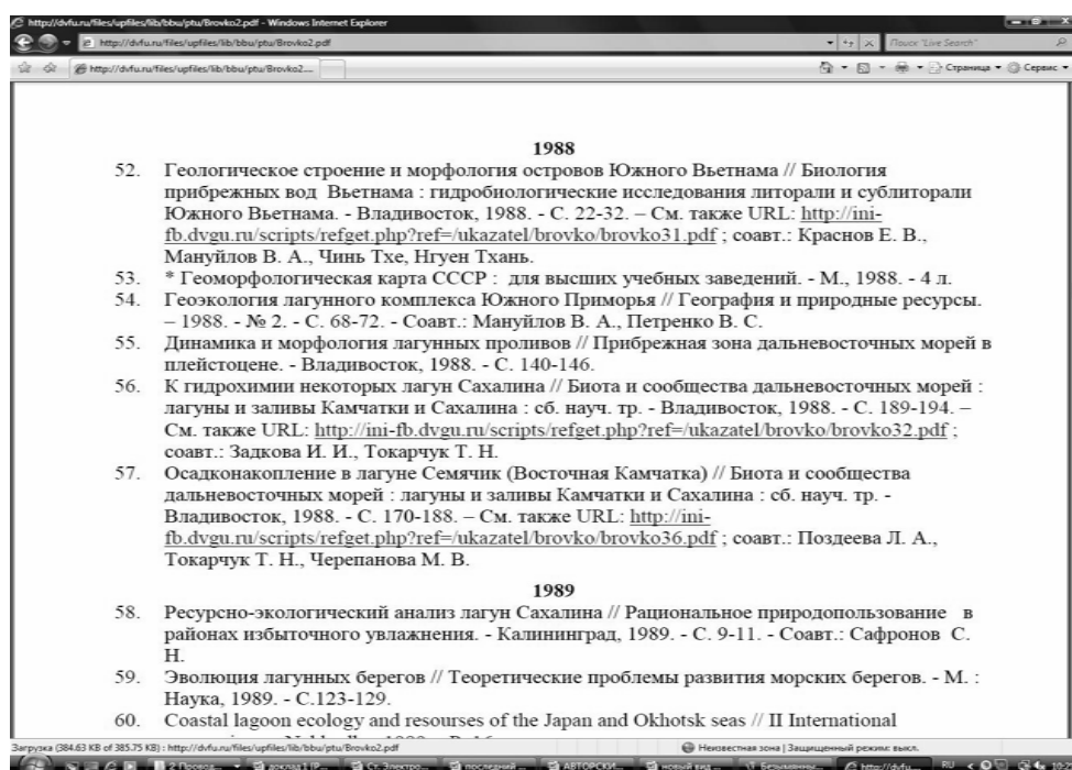
Рис. 3. Фрагмент указателя с гиперссылками