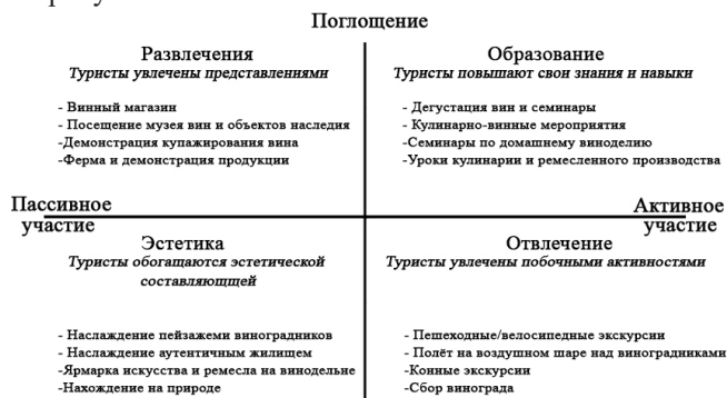
Рисунок 1 – Модель винного туризма (составлено автором по [16])

Согласно «4Е модели экономики впечатлений» предлагает четыре области эмпирической ценности, которые можно выделить в бизнесе. Четыре опыта различаются в зависимости от активного или пассивного участия клиента, а также от поглощения или погружения в опыт. Активное или пассивное участие влечет за собой степень вовлеченности клиента в создание опыта [15]. Типичная модель винного туризма представлена на рисунке 1.