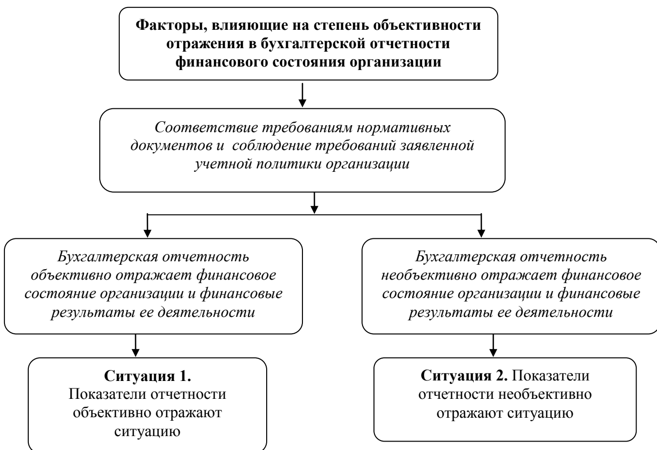
Рисунок 2 – Ситуации, возникающие при вуалировании данных бухгалтерской отчетности

Соколов Я.В. 1 приводит два типа ситуаций, возникающих при вуалировании данных бухгалтерской отчетности (рисунок 2).