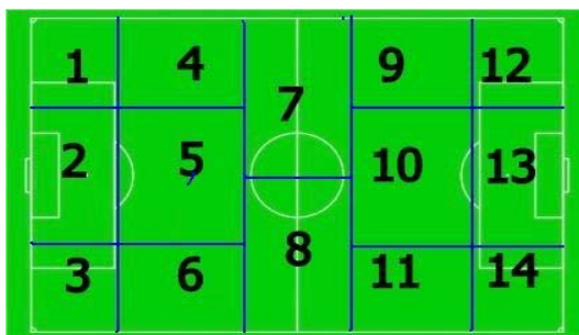
Рисунок 1. Игровые зоны футбольного поля