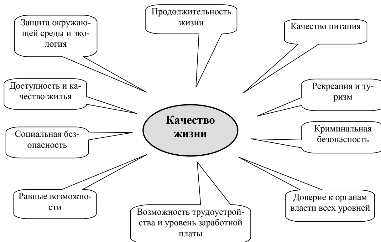
Рис.1 Факторы, определяющие качество жизни населения

мых низких по стране и составляет для женщин 63 года и 57 лет - для мужчин (по данным за 2006 год). По нашему мнению, сегодня и нет никаких предпосылок к повышению этого показателя, а скорее, наоборот, к его снижению. Чтобы достигнуть того самого среднего уровня заработной платы, большинство жителей края должны работать «на износ». А это увеличивает продолжительность рабочей недели, что усиливает суммарную усталость.