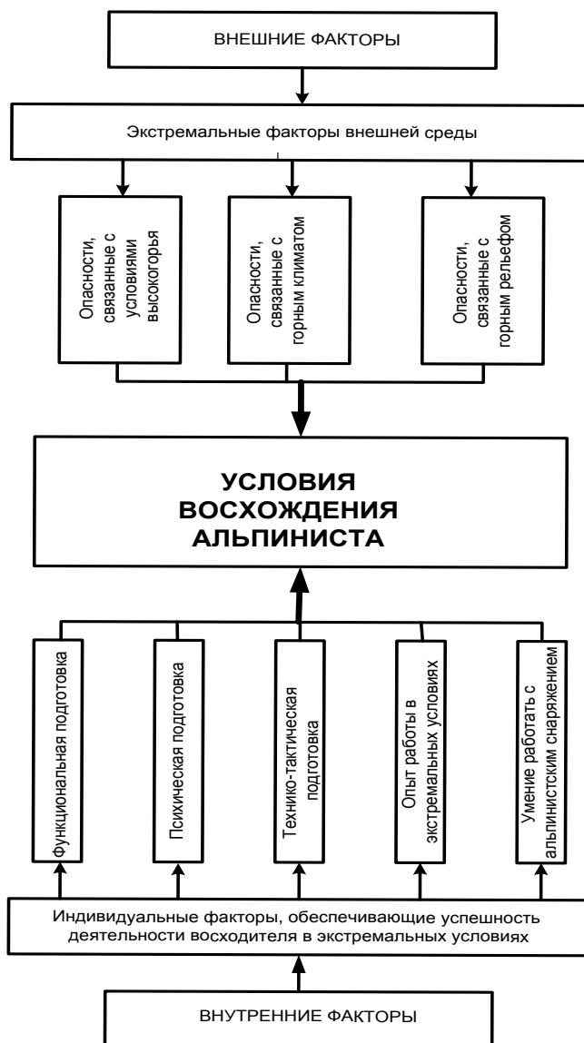
Рис. 2 – Схема влияния внешних и внутренних факторов на условия восхождения альпинистов

Таким образом, можно сделать вывод о том, что занятие альпинизмом – это довольно опасный вид спорта, требующий от спортсмена высокого уровня подготовки, значительного внимания к способам и средствам обеспечения безопасного для человека выполнения тех или иных действий в горах. Схема влияния факторов на условия восхождения позволяет на основе объектно-ориентированного подхода к анализу структуры внешних и внутренних факторов, определить конкретные пути уменьшения степени их влияния на альпинистов в условиях восхождения, прежде всего посредством реализации комплекса мероприятий по улучшению потребительских свойств одежды. К ним следует отнести: