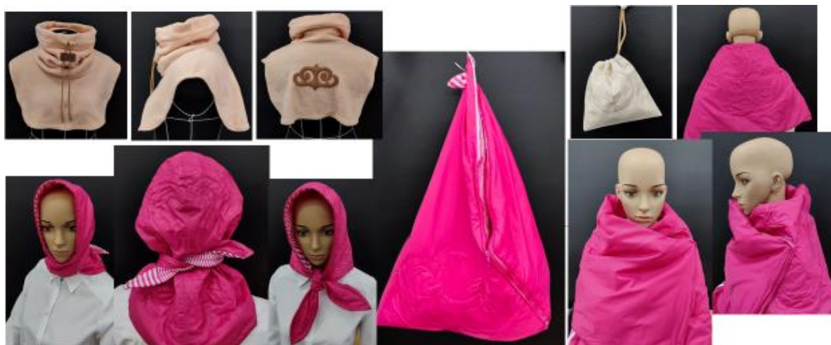
Рис. 3. Экспериментальный образец сумки-трансформера с комплектующими

В данном комплекте элементом новизны является использование при проектировании: