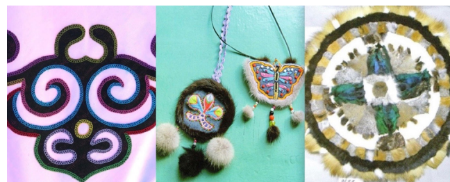
1) Нанайский орнамент. 2) Современные украшения негидалок. 3) Негидальский ковер ситкипун из полос меха в виде концентрических кругов. Рисунок 1 – Примеры орнамента и декоративно – прикладного искусства [31; 32].

– для развлечения детей на борту ВС можно предложить детскую литературу: это может быть книга дальневосточного писателя Дмитрия Нагишкина «Амурские сказки», созданная по мотивам фольклора нивхов, нанайцев, ульчей, удэгейцев и других народов Дальнего Востока, выполненная с красочными иллюстрациями Геннадия Павлишина и другая подобная литература; для маленьких детей – книжки-раскраски «Народы Дальнего Востока» и проч.