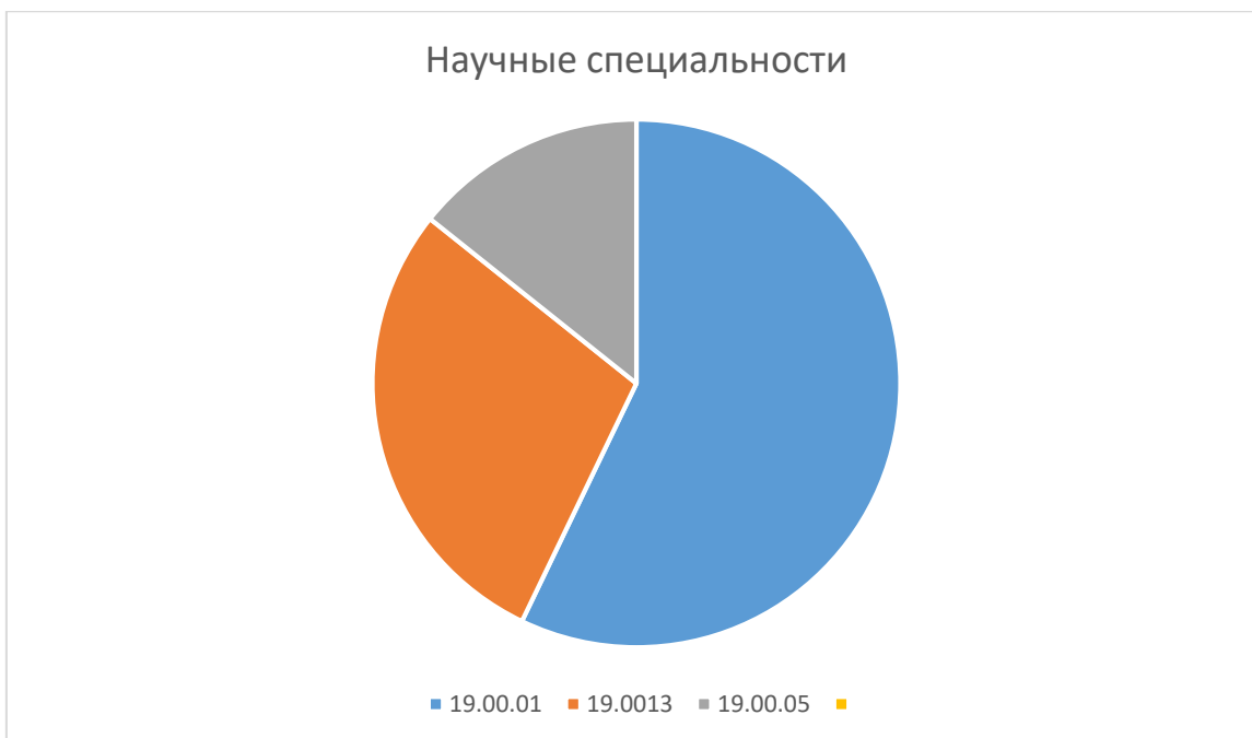
Рисунок 1 Защиты диссертаций на кафедре: научные специальности 19.00.01- Общая психология, психология личности, история психологии. 19.00.13- Психология развития, акмеология 19.00.05- Социальная психология

Несмотря на ограниченность научных специальностей (Рисунок 1), спектр научных интересов преподавателей кафедры достаточно широк, они транслируют полученные ими в исследованиях новые знания студентам и магистрантам, интегрируя в разрабатываемые курсы.