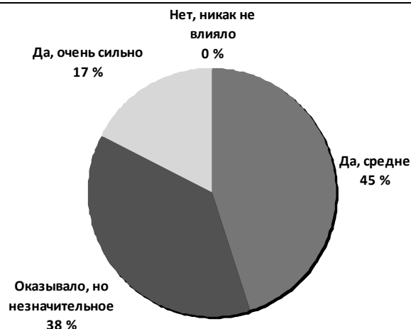
Рис. 1. Влияние технических сбоев на эффективность урока при дистанционном обучении

Респонденты выделили следующие отрицательные моменты: возникновение трудностей технического характера, проблемы с дисциплиной, мотивацией, сложности с восприятием материала, отсутствие возможности контролировать письменную и устную работу, неспособность ребенка самостоятельно работать с гаджетами. Самый большой недостаток, отмеченный участниками опроса, – это отсутствие возможности контролировать письменную работу у учеников (41%). 20% преподавателей выделили такой пункт, как сложности с восприятием материала, и 14% обозначили сложность с мотивацией учеников. Более подробно данные результаты отображены на рис. 2.