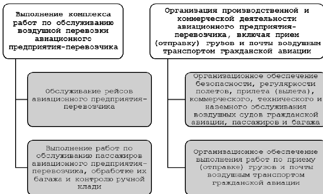
Рис. 1. Укрупненная схема функциональных обязанностей сотрудников представительств авиакомпаний

На первом этапе исследования согласно профстандарту 17.123 Представитель авиационного предприятия-перевозчика [1] выявлены функциональные обязанности сотрудников представительств авиакомпаний при осуществлении сервисной деятельности, представленные на рис. 1 в виде укрупненной схемы. Основными функциями представительства служит выполнение комплекса работ по обслуживанию воздушной перевозки авиационного предприятия-перевозчика, а также организация производственной и коммерческой деятельности авиапредприятия. Каждый блок функциональных обязанностей предусматривает достаточно большой перечень строго регламентируемых трудовых действий представителей.