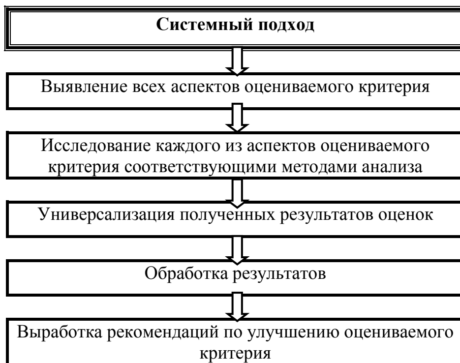
Рисунок 4. Алгоритм оценки эффективности управления предприятием при системном подходе.

Оценка эффективности управления предприятием при системном подходе осуществляется по алгоритму, представленному на рис. 4.