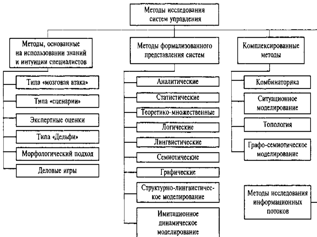
Рисунок 2. Методы исследования систем управления.