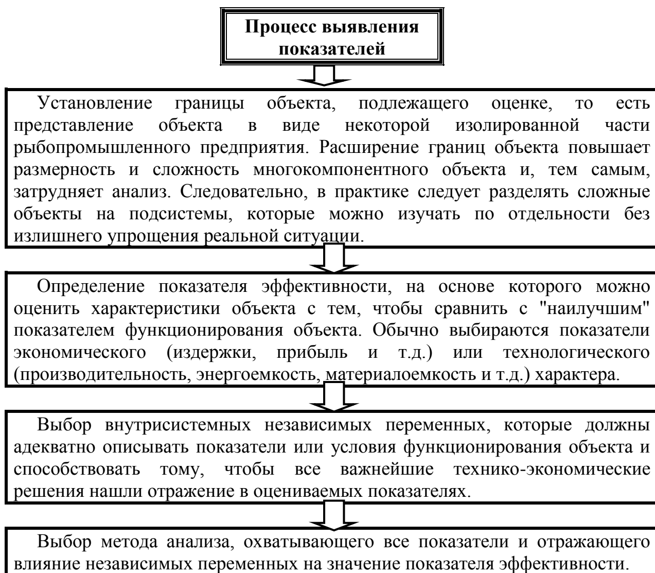
Рисунок 5. Алгоритм выявления оцениваемых показателей для рыбопромышленного предприятия.

По нашему мнению, процесс выявления оцениваемых показателей для рыбопромышленного предприятия должен осуществляться в последовательности, представленной на рис. 5.