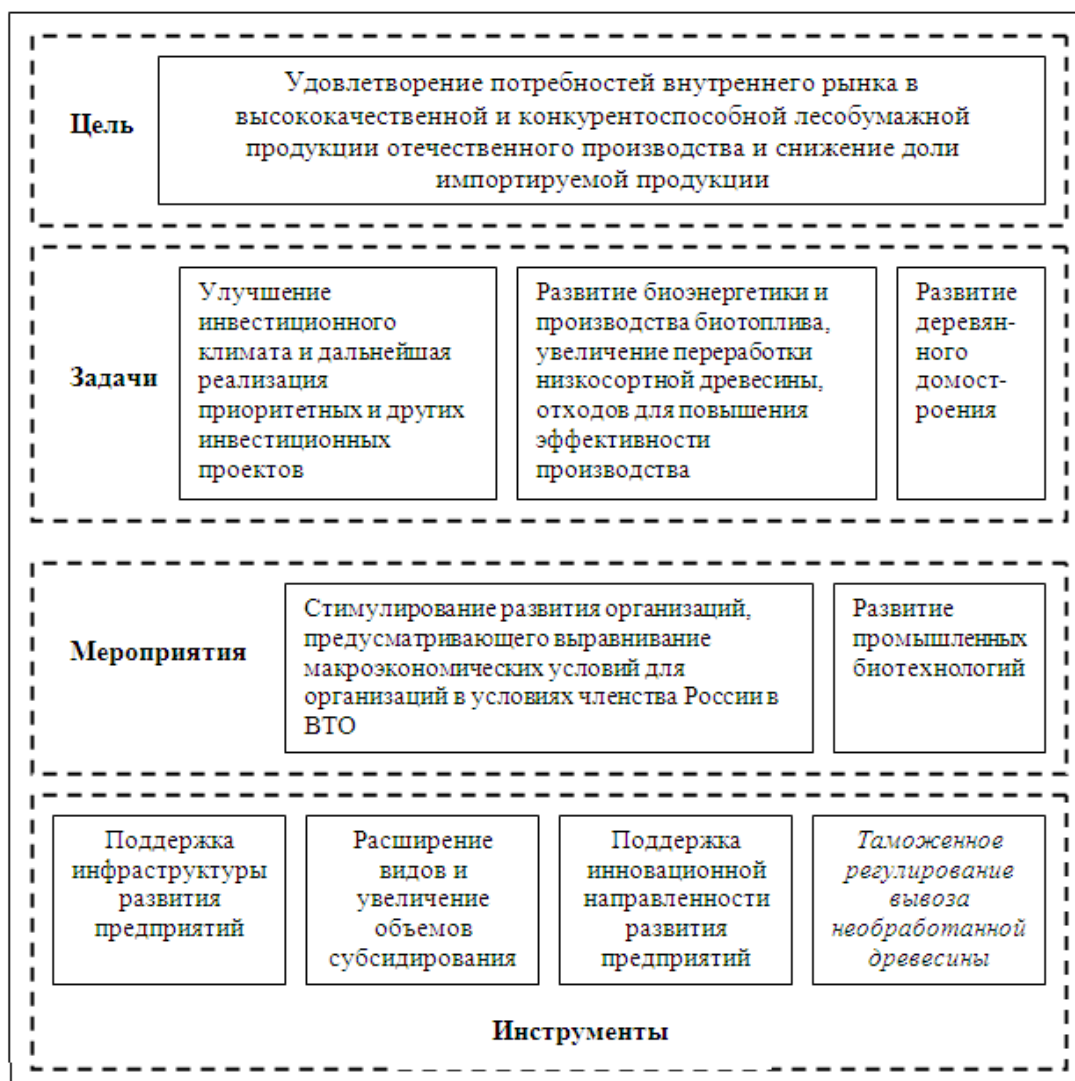
Рисунок. 1. Цель, задачи, мероприятия и инструменты реализации подпрограммы «Лесопромышленный комплекс» Государственной программы «Развитие промышленности и повышение ее конкурентоспособности» на период до 2020 г.

развития предприятий; ограничение числа организаций, имеющих право на экспорт лесоматериалов круглых хвойных пород в пределах таможенных квот (рис. 1).