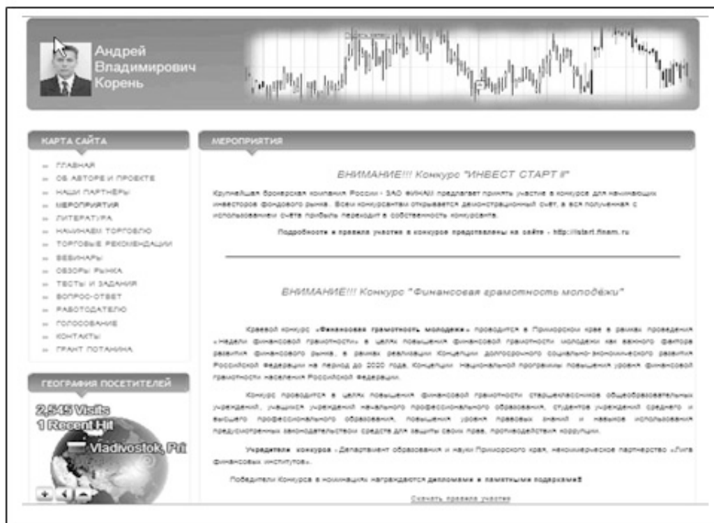
Рис.1. Пример образовательного сайта преподавателя для использования в учебном процессе вуза

- повышение доходов студентов, бакалавров и магистрантов уже после первого года обучения за счёт трансляции торговых сигналов с сайта в программные продукты обучающихся.