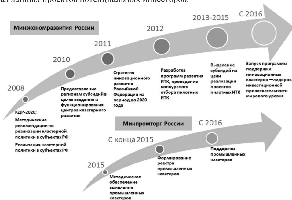
Рис. 1. Основные этапы реализации кластерной политики в России

По материалам Российской кластерной обсерватории на рис. 1 представлены основные этапы реализации кластерной политики. Причем описаны этапы только для двух направлений федерального уровня. Не представлены организация кластеров на региональном уровне и порядок их успешного функционирования, что объясняется особенностями отрасли экономики, самого региона, соседних с ним и т.д. [4].