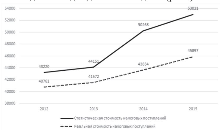
Рис. 3. Статистические и реальные величины стоимости доходной части налоговых поступлений бюджета Приморского края, тыс. руб.

Следует отметить, что в период 2013–2014 гг. этот параметр существенно превышал ожидаемый уровень, что, с нашей точки зрения, должно учитываться в оценке реальной динамики доходной части бюджета (рис. 3).