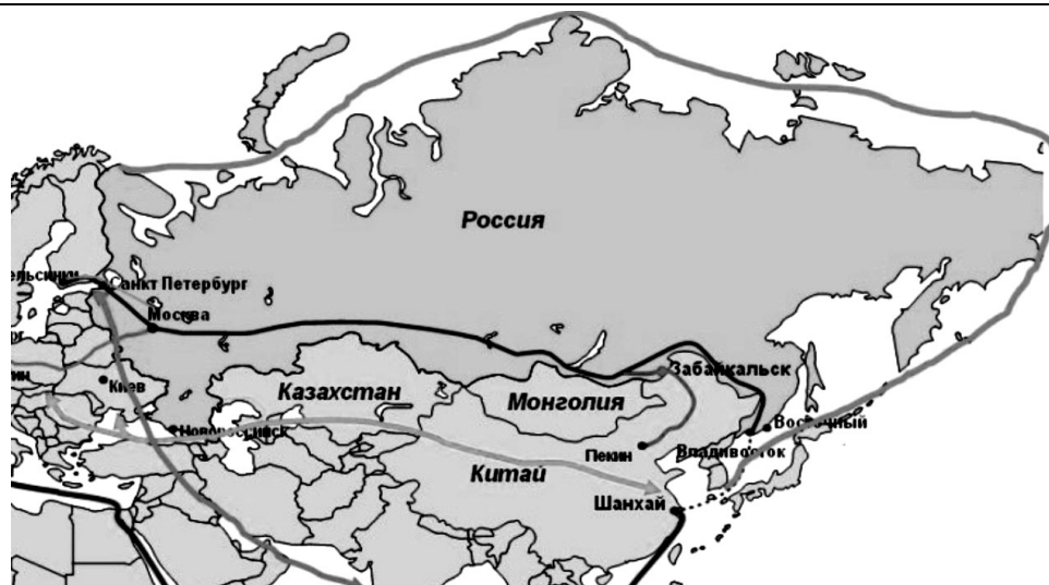
Рис. 4. Транспортные коридоры России