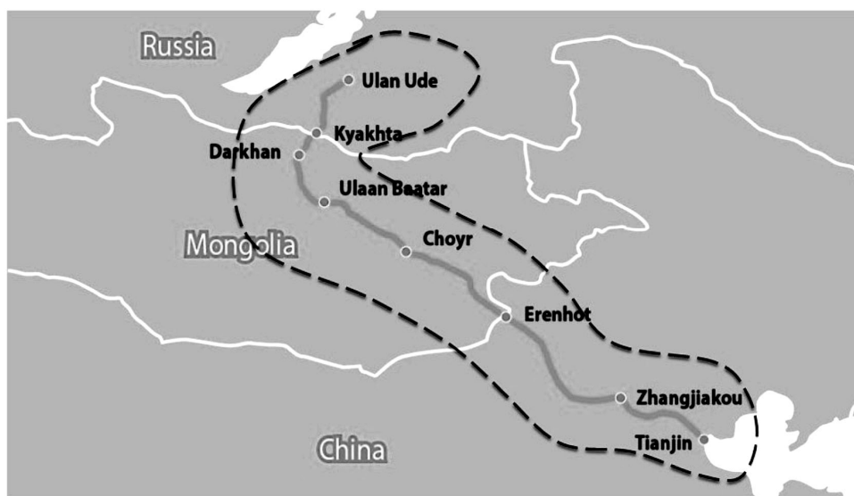
Рис. 3. Проект СЭЗ «Китай – Монголия – Россия»