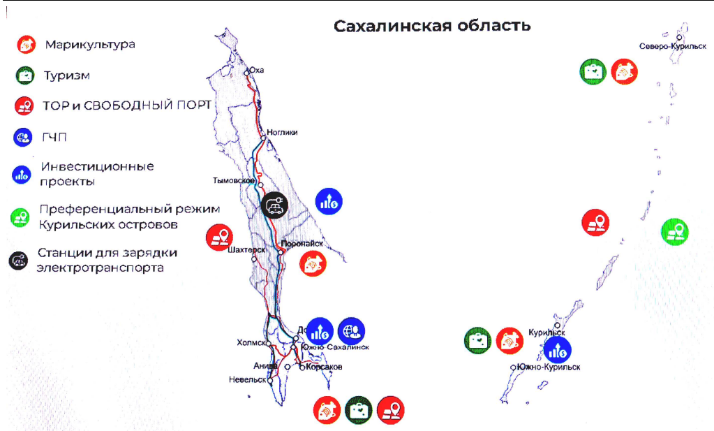
Рис. 1. Инвестиционная карта Сахалинской области