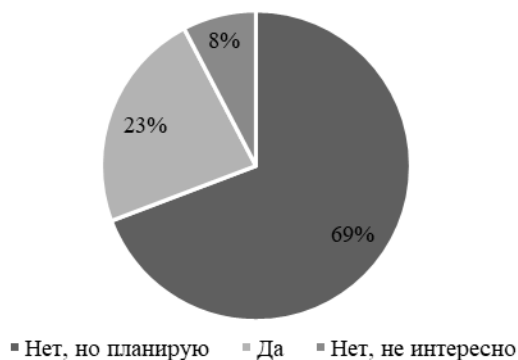
Рис. 4. Участия в организованных студенческих турах

Несмотря на готовность опрошенных участвовать в организованных студенческих турах (рисунок 4) отмечается ряд рекомендаций, связанных с увеличением числа университетов, оптимизацией механизма функционирования государственных программ и повышением осведомленности студентов и преподавателей о них.