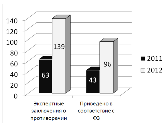
Рис. 3. Количество нормативных правовых актов Приморского края, в которых территориальным органом юстиции выявлены противоречия федеральному законодательству в 2011 – 2012 гг.

Поскольку одним из факторов, препятствующих привлечению зарубежных инвестиций, и это неоднократно подчеркивал Президент России, является высокий уровень коррупции в стране, серьезное внимание мы уделяем правовой и антикоррупционной экспертизе нормативных правовых актов Приморского края. Только за два последних года нами было выявлено 198 таких актов, из них 139 приведено в соответствие с требованиями федерального законодательства (рис. 3).