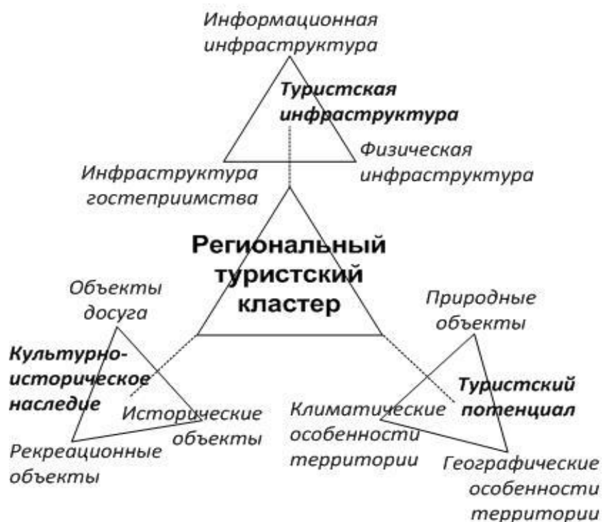
Рисунок 1 – Модель понятия «региональный туристский кластер»

На базе разработанной модели понятия «региональный туристский кластер» в диссертации сформулировано определение, характеризующее его как совокупность взаимосвязанных и взаимодействующих организаций, создающих комплексный туристский продукт, ориентированный на использование географических, климатических, природных особенностей территории; культурно-исторического наследия, включая исторические, рекреационные объекты, объекты досуга; туристской инфраструктуры, включая физическую, информационную инфраструктуры, инфраструктуру гостеприимства.