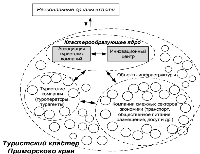
Рисунок 2 – Организационная модель регионального туристского кластера

зующее ядро в составе Ассоциации туристских компаний и Инновационного центра кластера; группа туристских компаний (туроператоров, турагентов); группа компаний смежных секторов региональной экономики (транспорт, общественное питание, размещение, досуг и др.).