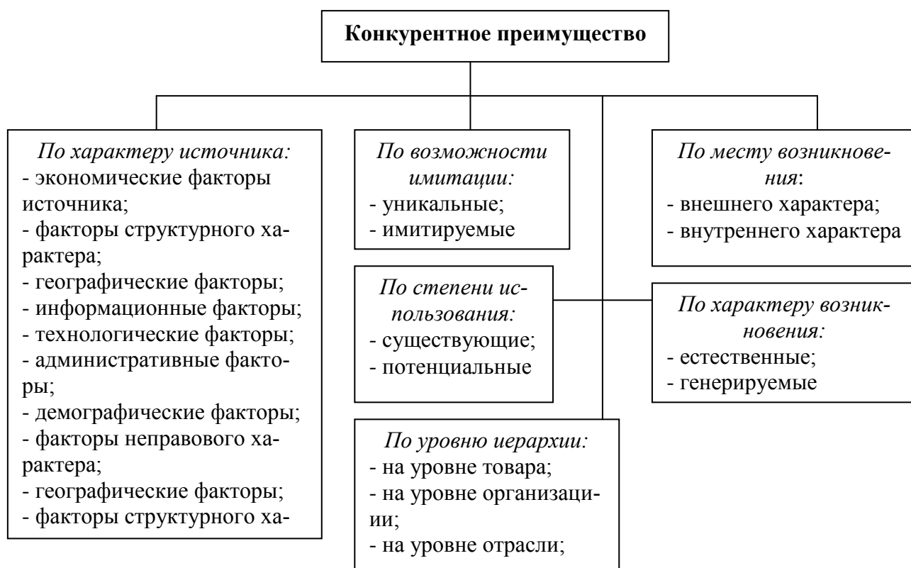
Рис. 2 Классификация конкурентных преимуществ

конкурентного преимущества: конкурентное преимущество на основе более низких издержек; конкурентное преимущество на основе дифференциаций. Низкие издержки отражают способность организации разрабатывать, выпускать и продавать сравнимый товар с меньшими затратами, чем конкуренты. Дифференциация – это способ обеспечить покупателя уникальной и большей ценностью в виде нового качества товара, особых потребительских свойств и послепродажного обслуживания. Эти оба типа конкурентных преимуществ позволяют предприятию получать большую прибыль, чем конкуренты. Вторым признаком классификации – сфера конкуренции, или широта цели, на которую ориентируется фирма в пределах своей отрасли (количество разновидностей товара, каналов сбыт и т.д.) [1].