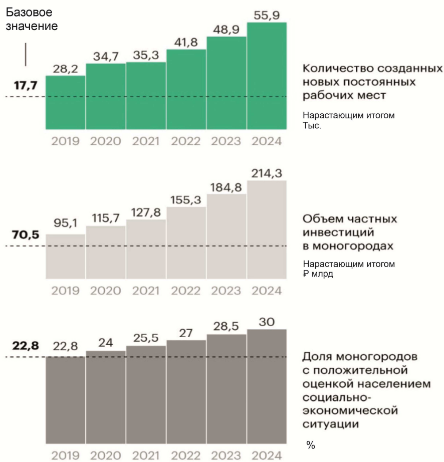
Рис. 1. Критерии экономического прогресса монофункциональных населенных пунктов

Чтобы активизировать экономический рост в пределах монопрофильных муниципалитетов, внедряется ключевой инструмент – так называемые территории опережающего развития, играющие существенную роль в поддержке инновационного развития. Суть данных территориальных единиц заключается в предоставлении специфических финансовых льгот, которые направлены на субъектов, ведущих бизнес-деятельность. Обычно эти территориальные зоны синхронизированы с границами соответствующих моногородов для устранения экономических слабостей и способствования предпринимательской активности [7].