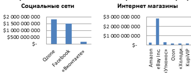
Рисунок 1 – Прибыль интернет магазинов и социальных сетей в 2013 году

Прибыль лидеров онлайн бизнеса за 2013 год представлена на рисунках 1, 2.