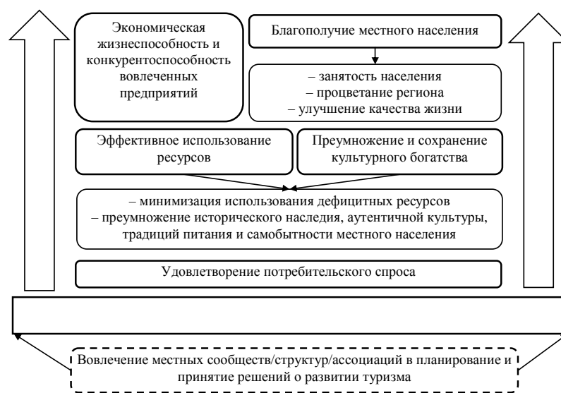
Рис. 2. Влияние гастрономического туризма на развитие региона (составлено автором)

Развитие гастрономического туризма прямо пропорционально росту экономического и социального развития региона (рис. 2).