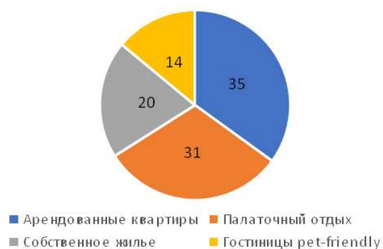
Рис. 2. Выбор условий размещения туристами, путешествующими с домашними животными, %

На основании данных статистики можно предположить и рост востребованности средств размещения для туристов с домашними животными, что требует своего дальнейшего подтверждения. Согласно исследованиям российской гостиничной сети AZIMUT Hotels, только 14% путешествующих с животными бронируют pet-friendly отели [11] (рис. 2). При этом 49% респондентов предпочли бы останавливаться с животными именно в таких гостиницах.