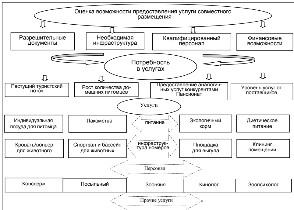
Рис. 3. Модель набора услуг совместного размещения в зависимости от потребности туриста с домашним животным

Возможность предоставления услуги совместного размещения во многом зависит от ряда факторов, к которым относятся рыночные факторы (соотношение спроса и предложения), возможность организации соответствующего пространства и оборудования для животных, наличие квалифицированного персонала и финансов. Распределение основополагающих факторов позволяет гостиничному предприятию разработать оптимальный набор услуг (рис. 3).