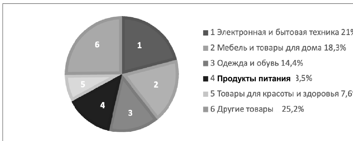
Рис. 1. Структура Интернет-продаж по группам товаров в 2022 году

В последние годы на рост онлайн продаж так же оказывают влияние COVID-19 и СВО в Украине с последующими санкциями против России. Курс рубля к иностранным валютам в феврале и марте 2022 года резко снизился, что вызвало ажиотаж среди населения. Чтобы сохранить имеющиеся активы, люди начали вкладывать средства в материальные объекты, в том числе в товары массового спроса. Так же в связи с уходом из России ряда зарубежных брендов таких как IKEA, Uniqlo, Zara, H&M некоторые из них устроили распродажу оставшихся на складах товаров, в том числе через интернет-площадки, что вызвало вторую волну ажиотажа среди населения.