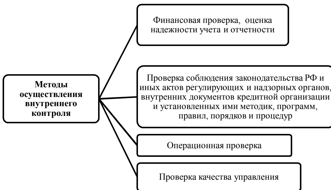
Рисунок 2 – Методы проверок службой внутреннего контроля

Программа проверок, осуществляемых службой внутреннего контроля, предусматривает разработку отдельной программы проверки каждого направления (вопроса) деятельности кредитной организации.