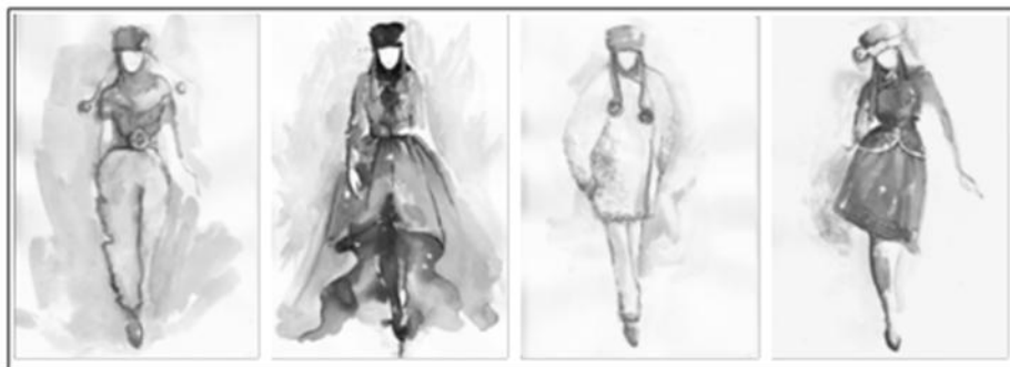
Рис. 4. Эскизы проектируемой коллекции «Ворожея»

При проектировании и создании коллекции «Ворожея» использовались разные методы проектирования костюма, но в частности – ассоциативный метод. Идея и замысел коллекции строится на создании художественного образа и на основе ассоциативных представлений о русском народном костюме. В ходе работы проводился поиск образного решения коллекции. Для этого проводился анализ русского традиционного костюма, модных тенденций в данном направлении, изучались методы создания современного костюма с использованием фольклорных элементов (рисунок 4).