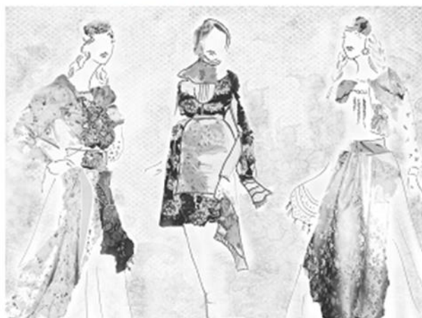
Рис. 1. Эскизы проектируемой коллекции «Крестьянка»

Коллекция «Крестьянка» - это не копия традиционных костюмов, а его трансформация в системе современного дизайна одежды (рисунок 1, 2, 3).