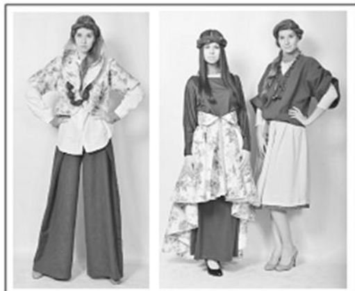
Рис. 5. Модели коллекции «Ворожея»

Таким образом, новизна коллекции заключается в ассоциативной интерпретации народного костюма в современный образ, стилистическом единстве деталей костюма и аксессуаров, в создании нового оригинального образа в этностиле (рисунок 5).