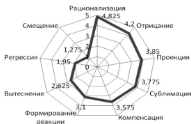
Рис. 1. Профиль психологических защит военнослужащих по результатам методики диагностики механизмов психологической защиты (Л.Ю. Субботина)