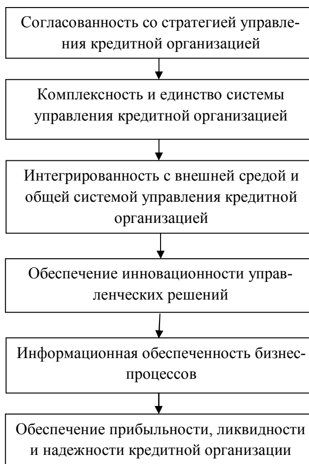
Рис. 3. Принципы финансового менеджмента кредитной организации.