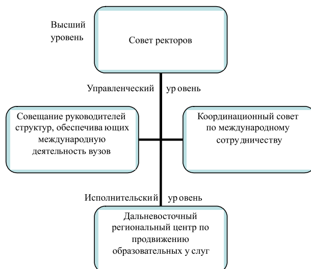
Рис. 1. Высший, управленческий и исполнительный уровни организации работы ДВРЦ