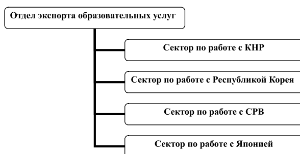
Рис. 3. Внутренняя организационная структура Отдела экспорта образовательных услуг

Специфика потенциальных рынков сбыта международных образовательных услуг дальневосточных вузов – китайского, корейского, японского, вьетнамского и т.д. – будет обуславливать организацию работы внутри этого отдела. Отдел должен иметь региональную ориентацию деятельности, как это представлено на рис. 3, поскольку