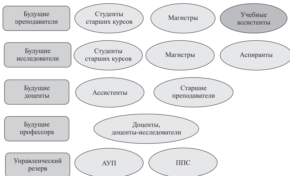
Рис 1. Категории кадрового резерва и источники их наполнения (учебные ассистенты – студенты старших курсов и магистры, которые помогают преподавателю готовить практические занятия, методические материалы и получают за свою работу ежемесячную доплату)

учными работниками, закрепление их во ВГУЭС, профессиональный рост и академическое развитие молодых преподавателей и исследователей, а также обеспечение университета профессиональными и квалифицированными руководящими кадрами». При этом противоречие относительно «открытого» или «закрытого» принципа формирования КР было снято следующим образом. Войти в КР могут не только сотрудники вуза, но для получения бонусов и дополнительной мотивации необходимым условием является переход в штат сотрудников университета. Противоречия во взглядах на состав участников КР и набор их компетенций снимались в результате выделения пяти категорий КР: будущие преподаватели, будущие исследователи, будущие доценты, будущие профессора, управленческий резерв (рис. 1).