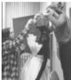
Рисунок 4 – Подготовка манекена для инсталляции

В процессе реализации проекта витрины студенты гр. БДК-14-01 и гр. БДК-12-01 (рис. 4) использовали творческий метод «мозгового штурма» [3, с. 230]. Принято общее композиционное решение – установка передка эвонимового костюма дизайнера костюма в преддверии конкурсных мероприятий. Все участники включились в творческий процесс поиска формообразования атрибутов, позволяющих реализовать идею.