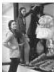
Рисунок 5 – Оформление витрины «Патшалык»

Для инсталляции были использованы методы, средства и материалы, необходимые дизайнеру костюма в его профессиональной деятельности: эскизы (использованы графические работы Феликс Никитин), манекены, бумага, ткань. Витрина выполнена в аэрографическом стиле (рис. 5). В создании образов применены методы фумигационности [4, с. 83], а также использованы фактура и свойства материалов. Черная манекены формируют целостный художественный образ. Белая бумага с эффектом плески увеличивает пространство витрины визуально. Пластичные, легкие линии на манекены бумаги придают пространству музыкальное звучание. Красный акцент в графике создает эффект выделенной детали. Созданный образ соответствует парадигматическим моделям тенденциям на сезон 2012-16 гг.