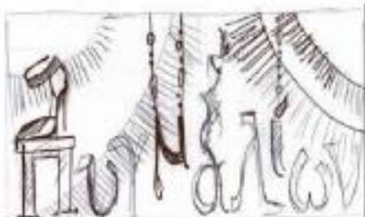
Рисунок 3 – Эскиз к витрине «Патшалык» ст. гр. БДК-14-01 Липовой Прима

В процессе реализации проекта витрины студенты гр. БДК-14-01 и гр. БДК-12-01 (рис. 4) использовали творческий метод «мозгового штурма» [3, с. 230]. Принято общее композиционное решение – установка передка эвонимового костюма дизайнера костюма в преддверии конкурсных мероприятий. Все участники включились в творческий процесс поиска формообразования атрибутов, позволяющих реализовать идею.