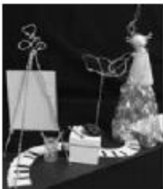
Рисунок 2 – Манект витрины «Патшалык» ст. гр. БДК-14-01 Черновой Прима