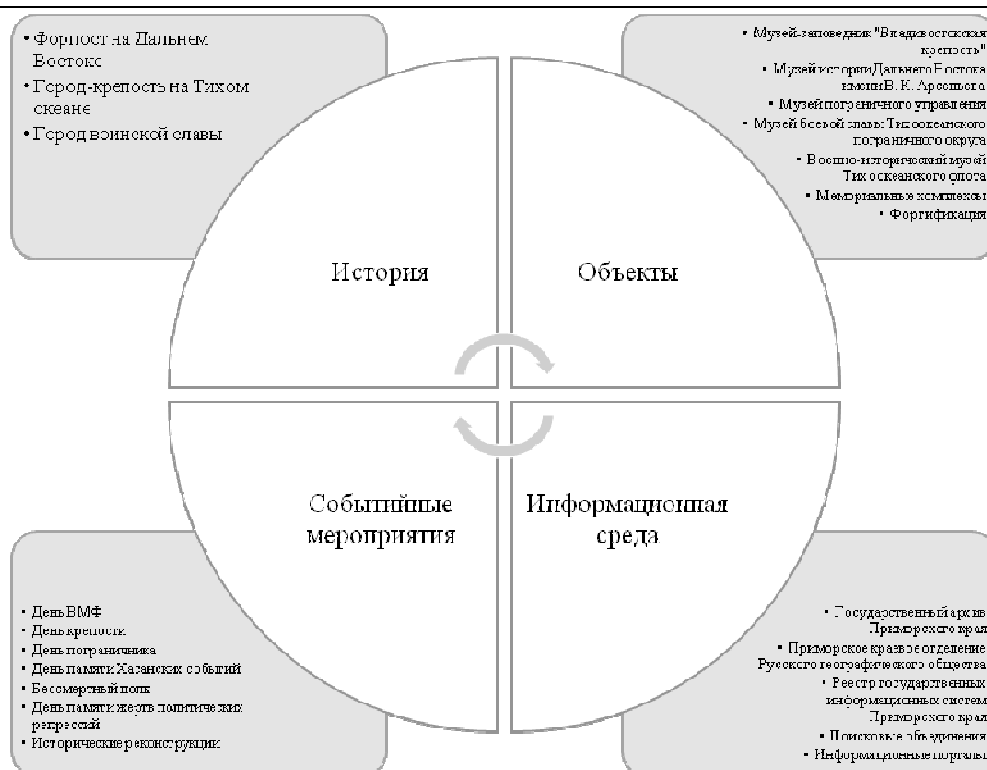
Рис. 3. Факторы развития военно-исторического туризма в Приморском крае

В результате из всех маршрутов Приморского края, перечисленных на сайте Туристско-информационного центра Приморского края, 23 маршрута (7,8 %) разделяют тему военного наследия [17]. Большая часть маршрутов проходит по территории Владивостока (14 маршрутов, или 61 %), остальные покрывают Хасанский, Шкотовский, Лазовский, Артемовский, Уссурийский, Находкинский и Партизанский районы.