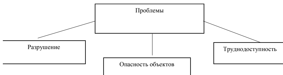
Рис. 4. Проблемы развития военно-исторического туризма

На примере главенствующих объектов Владивостокской крепости можно выделить и детально конкретизировать основные проблемы, препятствующие успешному развитию военно-исторического туризма в Приморском крае (рис. 4).