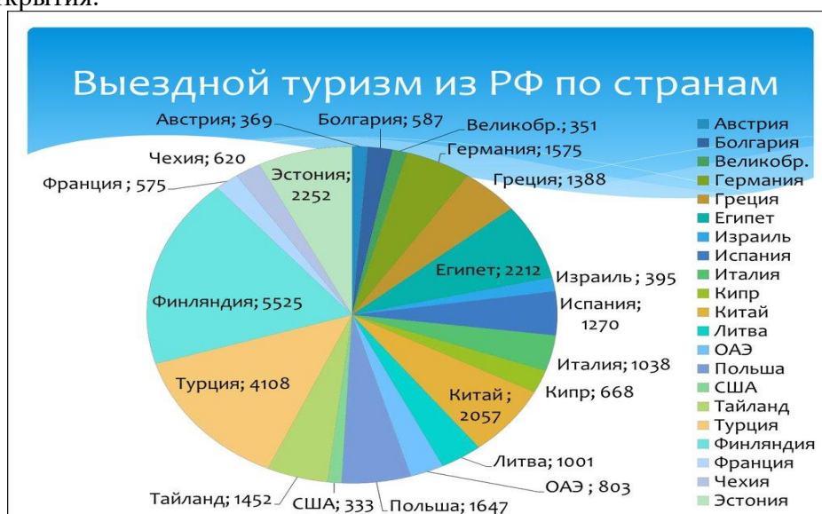
Рисунок 2 – Выездной туризм из РФ

Внутри страны более простые правила передвижения и более высокие доходы стимулируют местные исследования. На международном уровне выездной туризм в Китае постепенно восстанавливается с упором на захватывающие впечатления, оздоровление и культурные открытия.