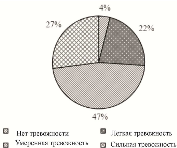
Рис. 2. Результаты исследования по критерию «Фобии»

Согласно данным, представленным в табл. 2 и на рис. 2, у 4% респондентов нет тревожности по фобиям; у 22% респондентов – легкая степень тревожности; у 47% респондентов – умеренная степень тревожности; у 27% респондентов – сильная степень тревожности. Фобии – это все устойчивые установки боязни материального или нематериального явления.