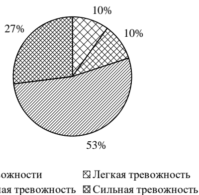
Рис. 4. Результаты исследования по критерию «Социальные страхи»

Анализ криминалистических страхов показал самую высокую тревожность по страхам (табл. 5, рис. 5): 57% респондентов имеют сильную степень тревожности; 16% респондентов – умеренную степень тревожности; 22% респондентов – легкую степень тревожности; 6% респондентов не имеют ее.