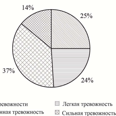
Рис. 6. Результаты исследования по критерию «Мистические страхи»

Таким образом, у студентов преобладает тревожность, особенно выраженная в области криминалистических страхов. Это может свидетельствовать о чувстве незащищённости. На такие результаты могли повлиять недавние события. Высокие показатели тревожности присутствуют в области социальных страхов, что может указывать на проблемы в общении и восприятии личности в обществе. Негативное влияние тревожности на повседневную жизнь выявлено как в области фобий, так и в учебных страхах.