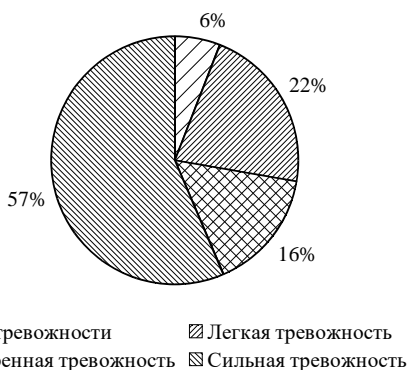
Рис. 5. Результаты исследования по критерию «Криминалистические страхи»