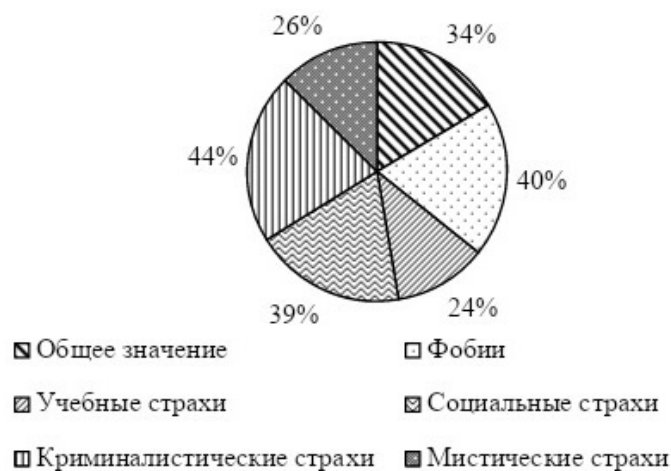
Рис. 1. Типы страхов, %

Среднее значение тревоги по всем видам страхов составило 34% (общий процент тревожности); 40% респондентов имеют среднее значение тревожности