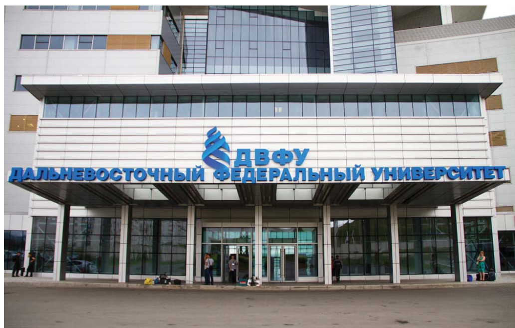
Дальневосточный федеральный университет

В контексте этой работы наибольший интерес гуманитарная экспертиза в образовании пред-