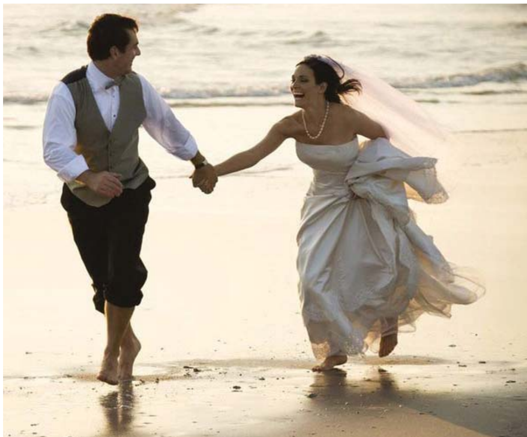
Так возникают счастливые семьи

Сходство семейных ценностей. Семейные ценности – это выработанный, открыто одобряемый и культивируемый семейным сознанием идеал, в котором содержатся абстрактные представления об атрибутах должного в различных сферах жизнедеятельности. Семейные ценности входят в психологическую структуру личности каж-