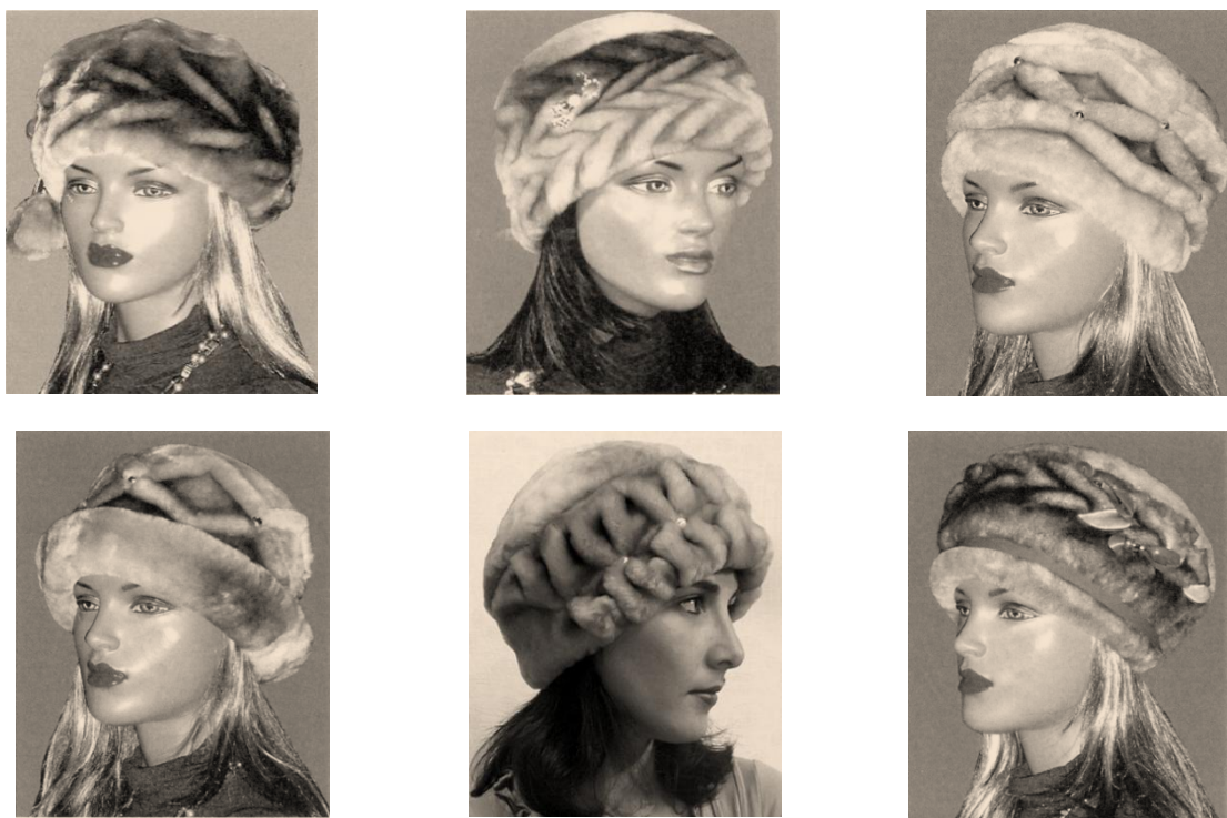
Рисунок 3 – Головные уборы из натурального меха с отделкой буфами [?]