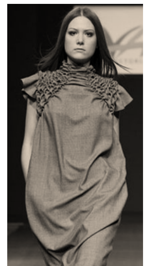
Рисунок 2 – Коллекция российского дизайнера Виктории Андреяновой