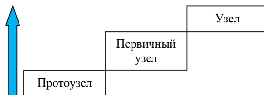
Рис. 1. Подтипы узловых элементов территориальной структуры

Приморского края осуществлялся правительством одновременно с колонизацией региона. Это делалось для удобства территориального управления отдаленной от европейской части российского государства территорией. И начался он гораздо раньше, чем были подписаны Айгуньский и Пекинский договоры, согласно которым за Россией юридически закреплялась территория нынешнего Приморского края. Об этом свидетельствует становление первых узловых элементов на юге Приморской области. Они располагались вдоль реки Усури, очерчивая будущую границу российского государства. Их образование носило политический характер и осуществлялось преимущественно казаками, вследствие чего их функции сводились к военно-административным, что соответствовало протоузлам – низший тип узловых элементов. На основании проведенного анализа авторами были определены подтипы узловых элементов территориальной структуры (рис. 1).