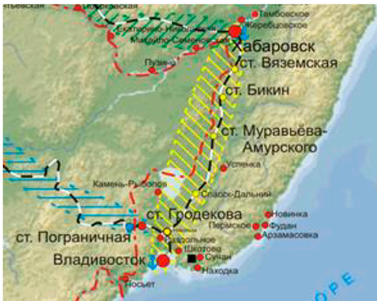
Рис. 3. Карта-схема территориальной структуры юга Приморского края

Выбранная правительством политика способствовала функциональному расширению промышленных центров: Владивосток, Уссурийск, Пограничный, Гродеково, Спасск-Дальний, Фокино, Находка. Основой для их дальнейшего экономического роста стало осуществление региональными органами власти задач промышленной политики – производство конкурентоспособной продукции – высокие технологии. Экономическое развитие узловых элементов способствовало становлению инфраструктуры в странах АТР. [3]. Их интегрированное взаимодействие способствовало формированию ареальных элементов системы, о чем свидетельствует политика тесного приграничного сотрудничества, которая вывела на новый, качественный уровень развития процесс территориального структурирования и районирования. В нем особую актуальность приобрело создание особых форм экономического взаимодействия в приграничной полосе [6]. Здесь были сформированы модели зонального (очагового) и «открытого рационализма» сотрудничества. На базе этих моделей создавались и функционировали приграничные торговые комплексы, а также территории опережающего социально-экономического развития. [4].