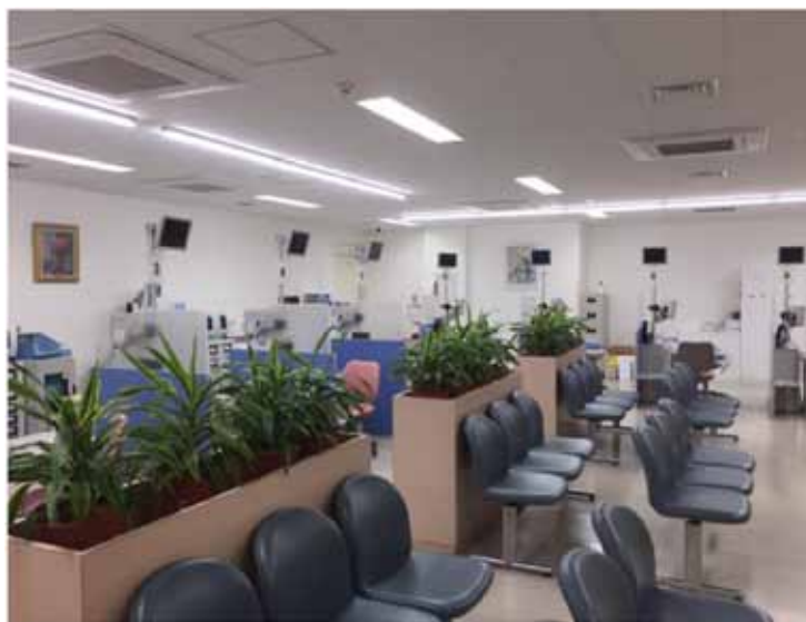
Рис. 3. Поликлиника университета Джунтендо (Токио, Япония).

Это способствует тому, что больной после приёма у врача не нуждается в длительной или самостоятельной доставке в лечебное учреждение, где он ещё раз пройдёт процедуру приёма у врача и оформления в приёмном отделении, а затем собеседования с дежурным и лечащим врачом, непосредственно занимающимся данным пациентом. Отсутствие такового алгоритма в медицинских учреждениях Японии сокращает количество не только врачей, но и среднего и младшего персонала, способствуют снятию дискомфорта у больного, вынужденного при наличии заболевания добираться в отдалённый стационар [7, 15]. Также это значительно сокращает не только экономические затраты как больного, так и лечебного учреждения, но и время до начала лечения. Положительным является также то, что история болезни после поликлиники поступает в стационар, поэтому сокращаются временные затраты на оформление больного в стационаре и собеседование с другими специалистами.