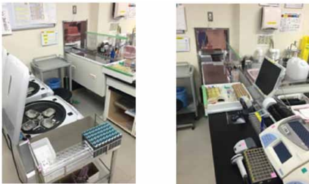
Рис. 5. Лаборатория университета Джунтендо (Токио, Япония).

Серьёзнейшей демографической проблемой в стране является стремительное старение населения Японии [2], количество людей старших возрастных групп и преклонного возраста в ближайшем будущем достигнет 25–30%. В Японии также намечается тенденция снижения уровня рождаемости. Эти данные свидетельствуют о предпосылках роста количества нуждающихся в медицинской помощи. Более ранние исследования, с использованием данных из системы японского долгосрочного страхования (LTCI) способствуют достижению цели здравоохранения Японии: дальнейшему росту средней продолжительности здоровой качественной жизни с 2011 до 2020 года и снижение доли инвалидности на 1% в год с 2011 года [9]. Оценка экономии в долгосрочной помощи и качественной медицинской помощи при росте продолжительности жизни социально активного населения позволит сэкономить от 2500 до 5300 миллиарда иен [17].