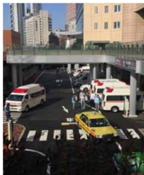
Рис. 2. Организация скорой помощи и доставки больных в университетской клинике (Токио, Япония)

Для доставки больного используются средства скорой помощи (рис. 2), включая специализированные автомобили и вертолёты, при этом клиники, как правило, оборудованы вертолётными площадками.