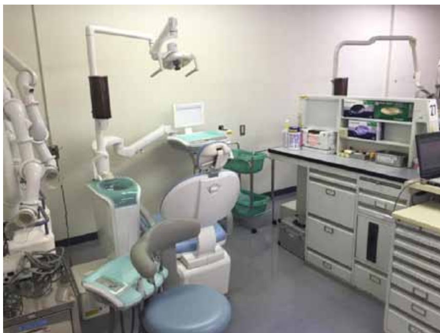
Рис. 4. Стоматологический университет, (Токио, Япония). Симуляционный центр для занятий студентов