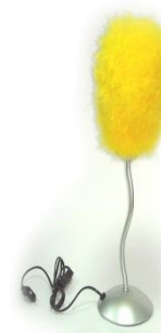
Рис. 4. Мех в интерьере

В этническом стиле гармонично смотрятся шкуры льва, тигра, леопарда, жирафа или зебры. Для оформления современных эклектичных или авангардных интерьеров, как