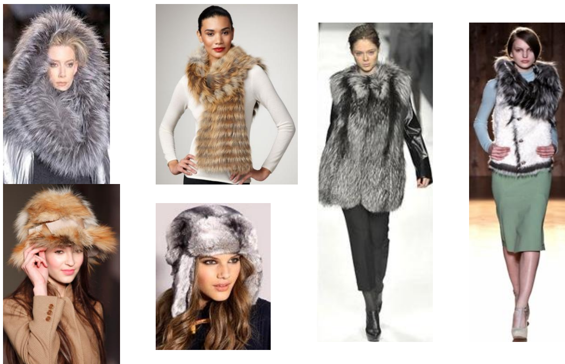
Рис. 1. меховые аксессуары в предметах гардероба

Успешно дополняют гардероб меховые сумки (рис. 2). Они выступают в роли самостоятельного независимого аксессуара, который в принципе может по цвету не подбираться ни под одежду, ни под обувь, ни под другие аксессуары. Главное – выдержать единый стиль в образе, а при выборе цвета нет никаких ограничений. Они смотрятся дорого, эффектно, изысканно. В этом сезоне известные мировые дизайнеры разработали огромное множество вариантов женских сумочек среднего размера, с короткими ручками, разных фасонов, цветовых решений и элементов декора. При этом носить их рекомендуется исключительно в руках, а не вешать на плечо.