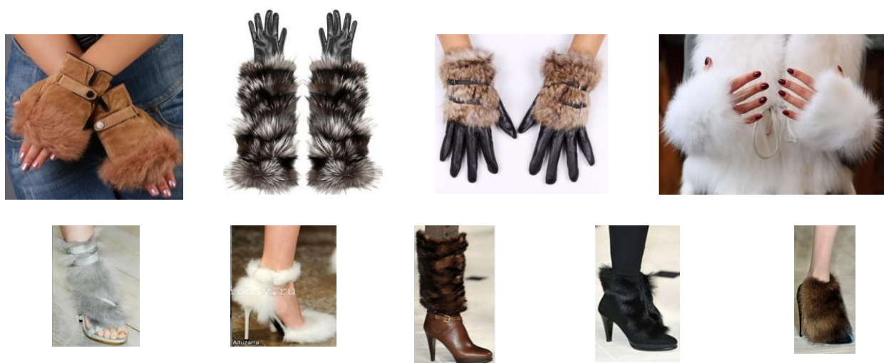
Рис. 3. Меховые перчатки, митенки и обувь с элементами меха

Мех, выполняя эстетическую функцию, выступает роскошным элементом декора в виде меховой отделки обуви и перчаток (рис. 3). Обувь с элементами меха - самый яркий тренд зимнего и предстоящего летнего сезона. Перчатки с манжетами из меха эффектно дополняют и платья с короткими рукавами. Они могут быть не только украшены мехом, но и выполнены из него, преобразуясь в митенки. Митенки – это перчатки без пальцев, удерживающиеся на руке с помощью перемычек между пальцами или за счет пластических свойств материала, из которого они сделаны. Они либо защищают руки от холода, либо обеспечивают надежное сцепление при удержании спортивного снаряда, не сковывая движения пальцев, либо выполняют эстетическую функцию. Поэтому в одних случаях материал может, немного прикрывать пальцы или закрывать только ладонь и тыльную сторону руки, в других – закрывать часть руки и по длине доходить как до ее середины, так и до локтя. Сегодня митенки – необычайно популярный аксессуар гардероба.