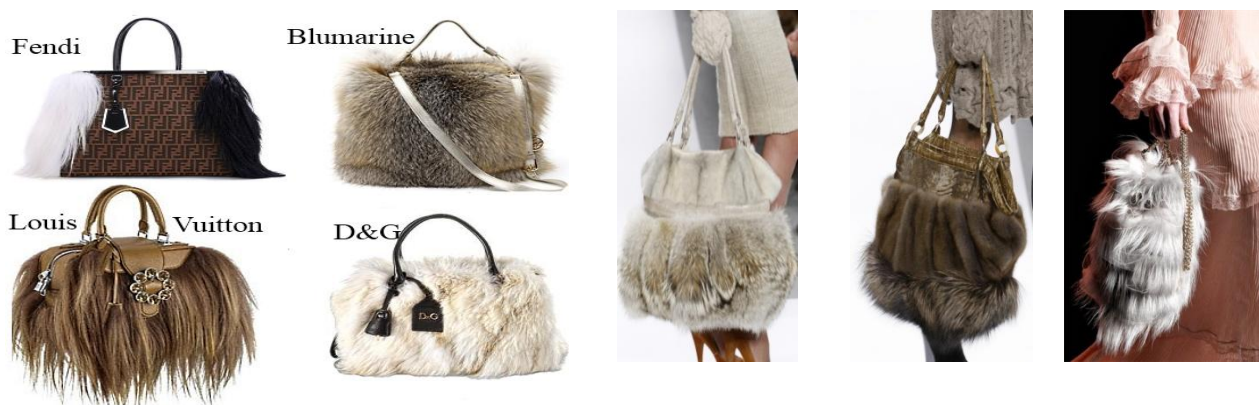
Рис. 2. меховые сумки

Успешно дополняют гардероб меховые сумки (рис. 2). Они выступают в роли самостоятельного независимого аксессуара, который в принципе может по цвету не подбираться ни под одежду, ни под обувь, ни под другие аксессуары. Главное – выдержать единый стиль в образе, а при выборе цвета нет никаких ограничений. Они смотрятся дорого, эффектно, изысканно. В этом сезоне известные мировые дизайнеры разработали огромное множество вариантов женских сумочек среднего размера, с короткими ручками, разных фасонов, цветовых решений и элементов декора. При этом носить их рекомендуется исключительно в руках, а не вешать на плечо.